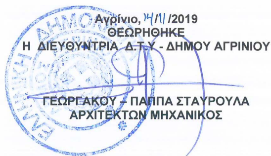
ΓΕΩΡΓΑΚΟΥ - ΠΑΠΑ ΣΤΑΥΡΟΥΛΑ ΑΡΧΙΤΕΚΤΩΝ ΜΗΧΑΝΙΚΟΣ